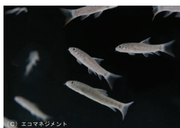
(C) エコマネジメント